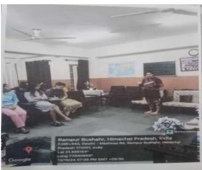
Rampur Buzhafr, Himachal Pradesh, India 8148442, Delhi - Max Road, Rampur Buzhafr, Himachal Pradesh 172001, India Lat: 31.488156° Long: 77.488089° 1571624 07:30 PM GMT +05:30