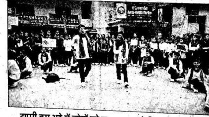
टापरी बस अड्डे में लोगों को जागरूक करते विद्यार्थी। संवाद

भावानगर (किन्नौर)। जिनदल विद्या मंदिर छोलू में छात्रों ने नुक्कड़ नाटक के माध्यम से नशे के खतरे का संदेश दिया। छात्रों ने जेएसडब्ल्यू के सुरक्षा विभाग के साथ मिलकर धूम्रपान और तंबाकू से होने वाले नुकसान को लेकर जागरूकता रैली निकाली। यह रैली जेएसडब्ल्यू के मुख्य कार्यालय से लेकर टापरी मुख्य बाजार तक निकाली गई। बच्चों ने लोगों को धूम्रपान और नशे के दुष्प्रभाव बताए। इस अवसर पर बच्चों की ओर से टापरी बस स्टैंड में डब्ल्यूएचओ के वर्ष 2023 के थीम भोजन की आवश्यकता है, तंबाकू की नहीं विषय पर नुक्कड़ नाटक प्रस्तुत किया गया, सभी दर्शकों ने बच्चों के इस प्रयास को खूब सराहना की। संवाद