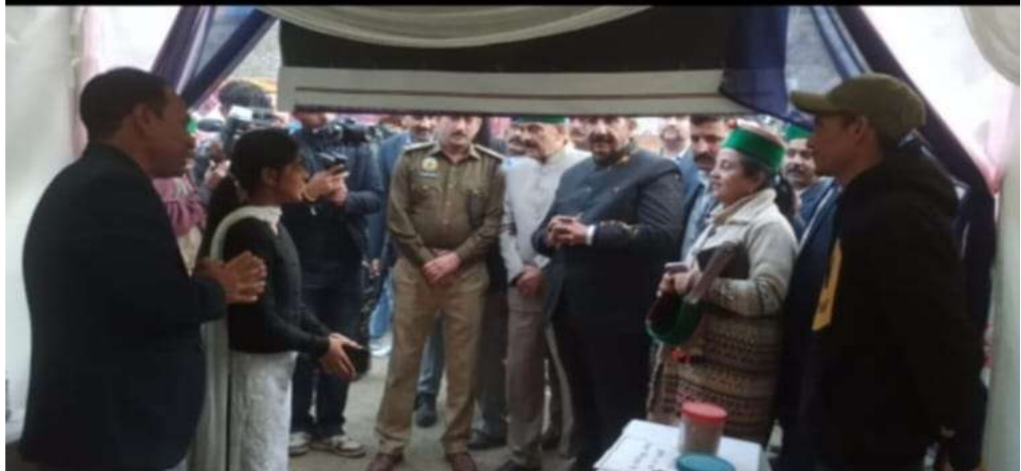
Geography Exhibition regarding Millets in International Lavi Fair (11-14 Nov, 2023)