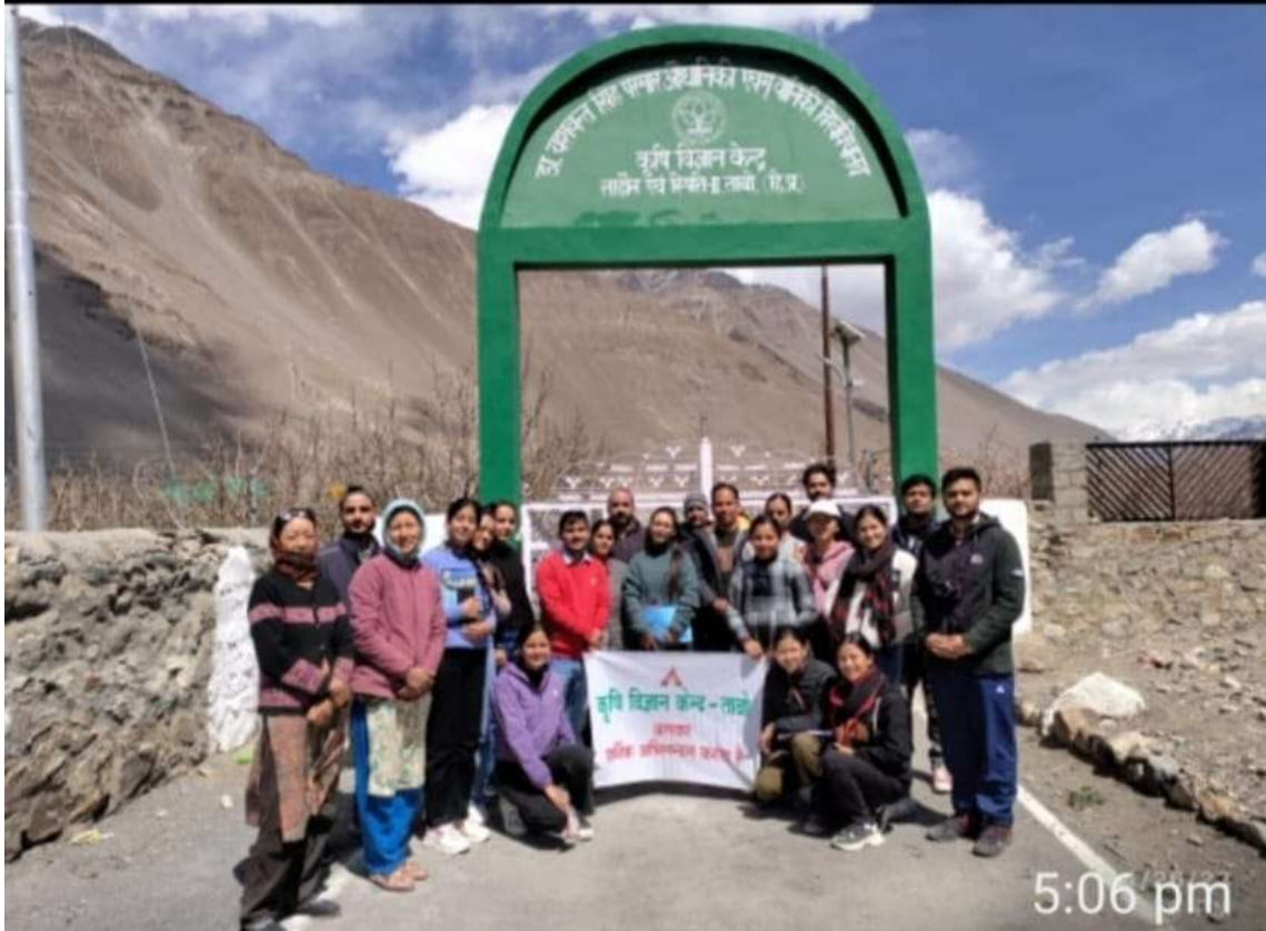
Student visit to Krishi Vigyan Kendra Tabo (Spiti)