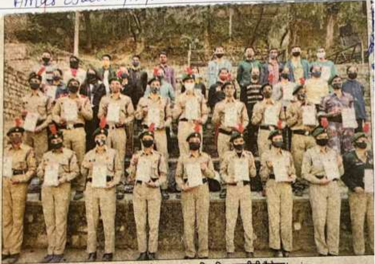
रामपुर में एनसीसी दिवस के अवसर सम्मानित किए एनसीसी कैडेट्स। -संवाद