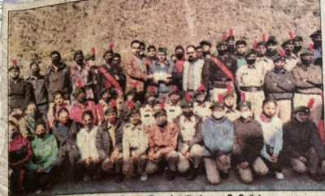
सेना झंडा दिवस पर एकत्रित राशि को सौंपते एनसीसी कैडेट्स। -संवाद