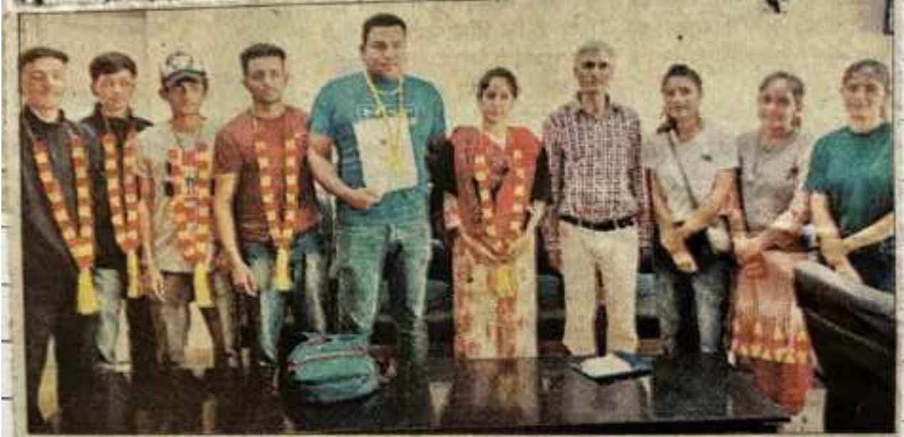
रामपुर कॉलेज की टीम धर्मशाला से स्वर्ण पदक जीतने के बाद कॉलेज प्रबंधन के साथ।