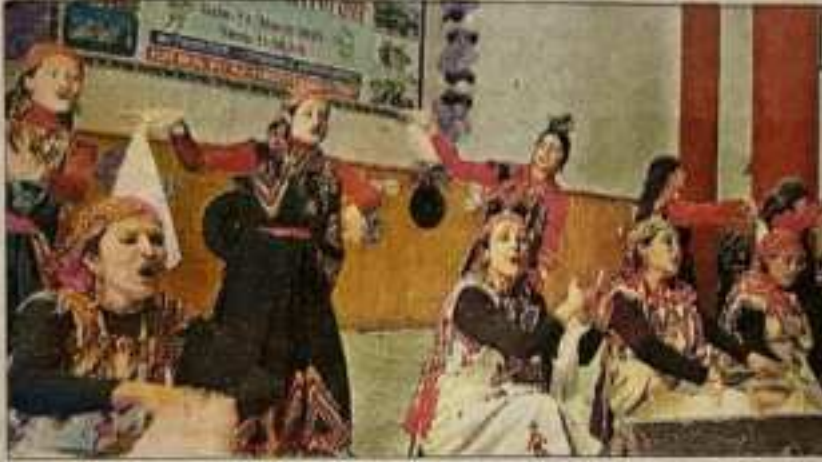
रामपुर महाविद्यालय में आयोजित सांस्कृतिक कार्यक्रम में कुल्लची नाटी परा कबती छात्राएं। -संवाद