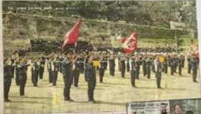
खेलकूद प्रतियोगिता के अवसर पर रामपुर में आयोजित खेलकूद प्रतियोगिता में भाग ले रहे खिलाड़ियों का दृश्य।