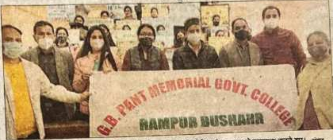
सड़क सुरक्षा क्लब के सदस्य प्रतियोगिता के दौरान पोस्टर प्रतियोगिता के माध्यम से जागरूक करते हुए। -संवाद