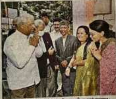
शिक्षा नीति पर आयोजित कार्यक्रम में अतिथित बहोला करने कार्यक्रम।

राष्ट्रीय शिक्षा नीति इस क्षेत्र को लेकर नया है। इस देश में शिक्षा प्रणाली की शिक्षा होने चाहिए और किस प्रकार शिक्षा का प्रभाव बन सके। यह संकेत प्रवृत्ति और सभी में नया संकेत है। शिक्षा