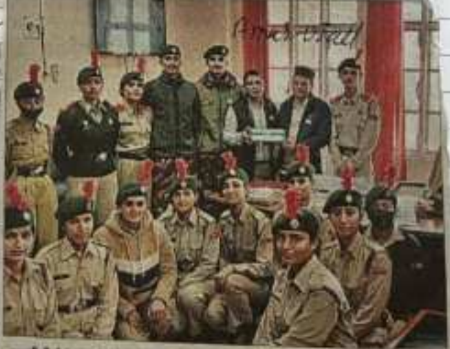
एनसीई के डेटमेंट की ओर से शहीदों के परिवारों के लिए समर्थन