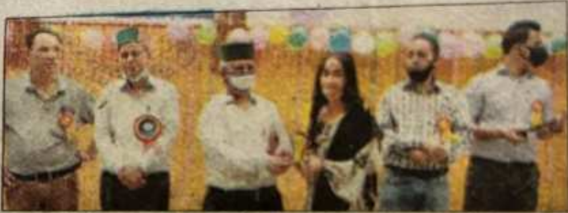
पीजी कॉलेज रामपुर में विद्यार्थियों को सम्मानित करते मुख्यातिथि।