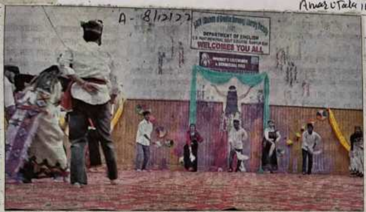
पीजी कॉलेज रामपुर में अंग्रेजी विभाग द्वारा आयोजित कार्यक्रम में प्रस्तुतियां देते कलाकार। -संवाद