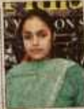
अपराजिता कार्यक्रम में भाग ले रही महिला।