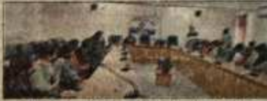
बीबी कॉलेज रामपुर में एनएचएस विधिवत रूप से कार्य करने के लिए प्राथमिक प्रशिक्षण देती है।

उन्होंने स्वयंसेवियों को एनएचएस की गतिविधियों और अनुभवों में सहभागिता के लिए कहा है।