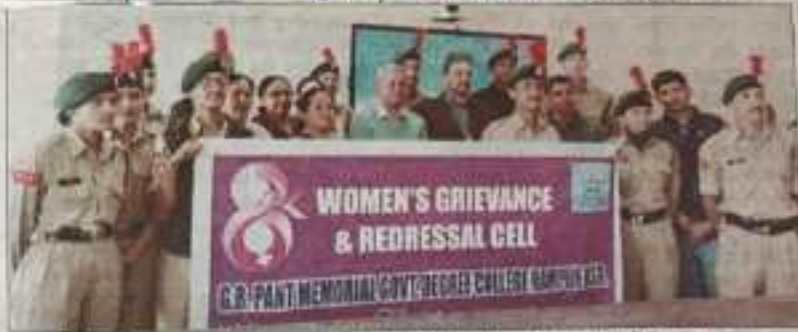
पौजी कॉलेज रामपुर में लैंगिक समानता को लेकर आयोजित कार्यक्रम में मौजूद प्राचार्य और अन्य।