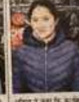
अपराजिता कार्यक्रम में भाग ले रही महिला।