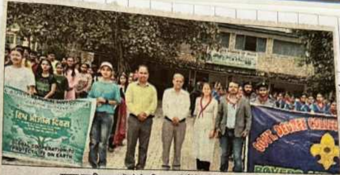
रामपुर महाविद्यालय में ओजोन दिवस पर रैली निकालते छात्र और छात्राएं।