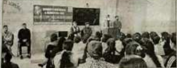
राज्य विधायक रामपुर कालेज में समझाया पोक्सो एक्ट