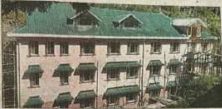
रामपुर कॉलेज में निर्माणाधीन साइंस ब्लॉक भवन।

संवाद न्यूज एजेंसी 5/10/22 सैकड़ों विद्यार्थियों को मिलेगी सुविधा, कार्य अंतिम चरण में