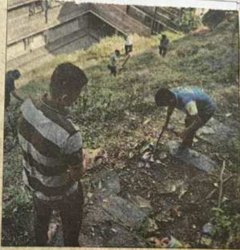
रामपुर कॉलेज के छात्रावास में सफाई करते छात्र।