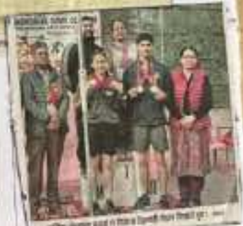
खेलकूद प्रतियोगिता में भाग ले रहे खिलाड़ियों का दृश्य।