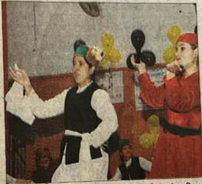
पीजी कॉलेज रामपुर में वाणिज्य विभाग की ओर से राष्ट्रीय उपभोक्ता दिवस पर नाटी के माध्यम से लोगों को जागरूक करती छात्राएं।