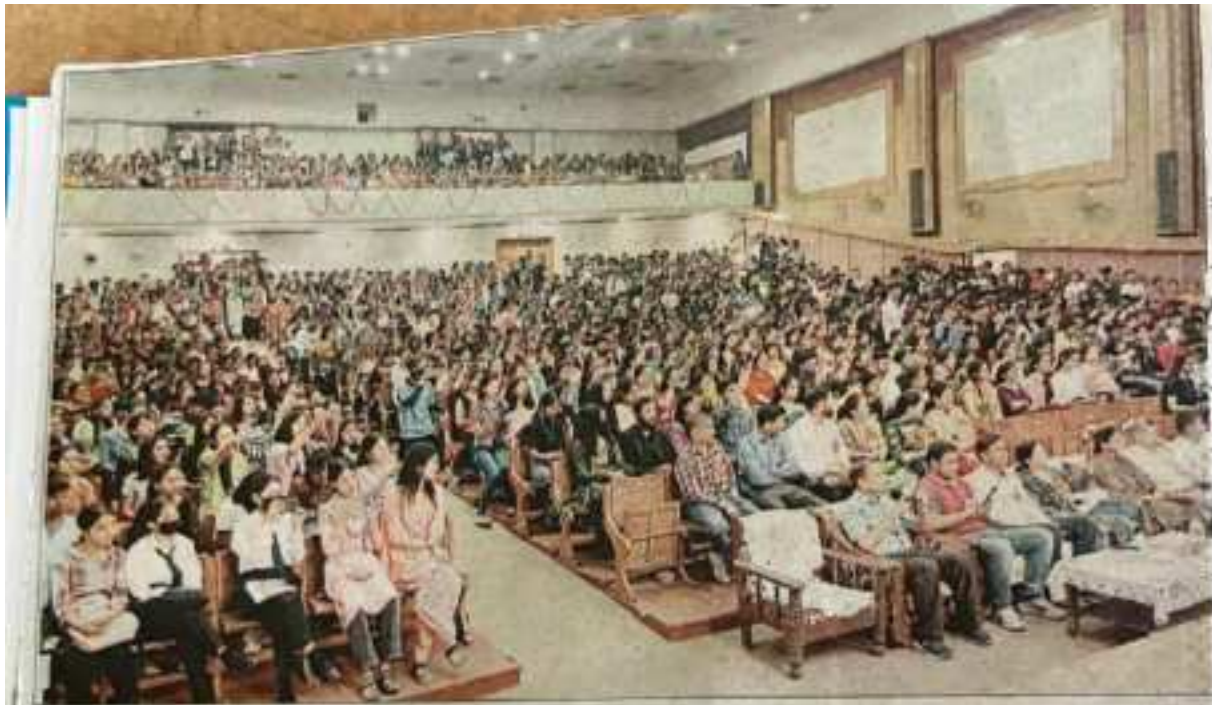
पीजी कॉलेज रामपुर में आयोजित हिंदी दिवस के मौके पर आयोजित कार्यक्रम में मौजूद छात्र-छात्राएं और शिक्षक।