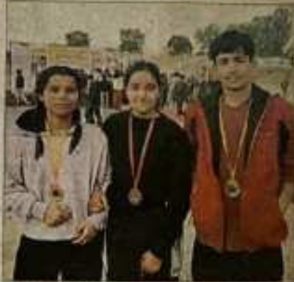
इंटर कॉलेज प्रतियोगिता में खेले गए चारों ओर के चार खेलों में सुन्दरनगर के चार खिलाड़ियों ने जीते चार पदक जीते हैं।

इस प्रतियोगिता में खेले गए चार खेलों में सुन्दरनगर के 4 खिलाड़ियों ने सुन्दरनगर में जीते चार पदक जीते हैं। चारों ओर के चार खेलों में सुन्दरनगर के चार खिलाड़ियों ने 52 खिलाड़ियों में खेले, जिनमें से 48 खिलाड़ियों में 1997, 1998 और 1999 में 52 और 56 खिलाड़ियों में खेले गए चार खेलों में सुन्दरनगर के चार खिलाड़ियों ने जीते चार पदक जीते हैं।