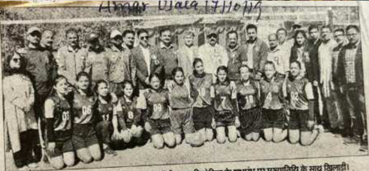
रामपुर महाविद्यालय में इंटर कॉलेज छात्रा वॉलीबाल प्रतियोगिता के शुभारंभ पर मुख्यालय के साथ खिलाड़ी।