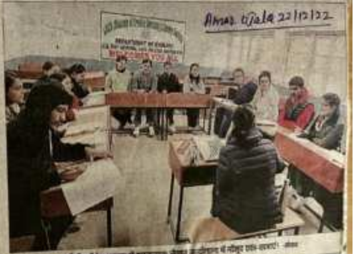
श्रीमती कॉलेज रामपुर में रचनात्मक लेखन कार्यशाला में सीटिंग एड-अप।