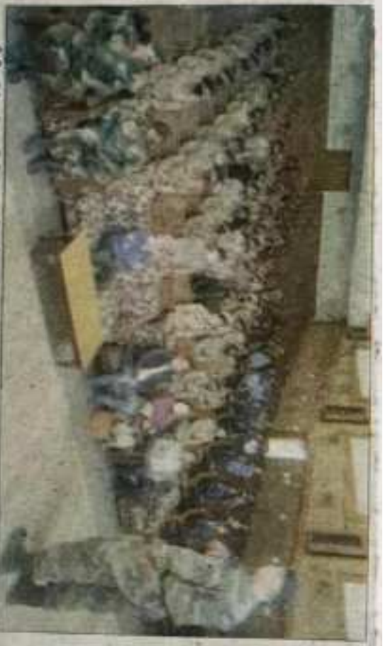
पीजी कॉलेज में एनसीसी के माता शिवश्री प्रशिक्षण शिक्षक के शुभारंभ पर सजाए गए एनसीसी कैडेट्स। सभार