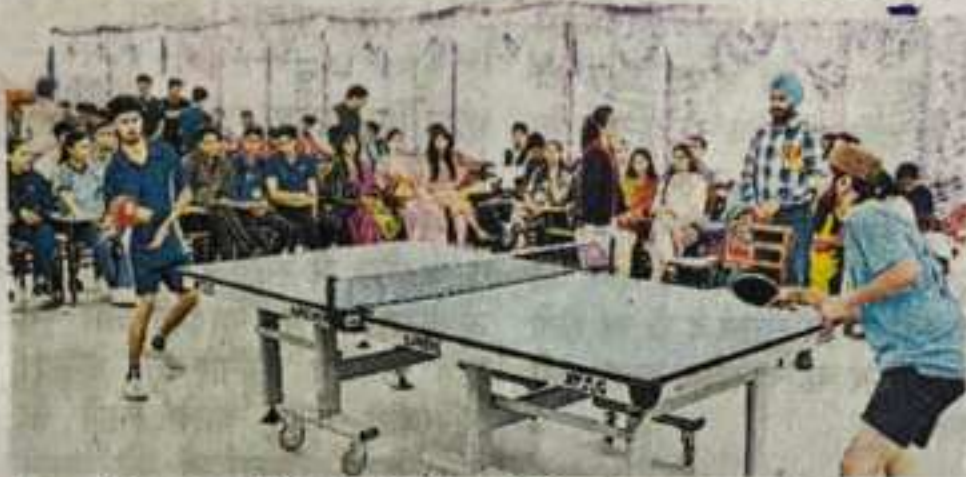
इंटर कॉलेज टेबल टेनिस प्रतियोगिता में खेलते खिलाड़ी।