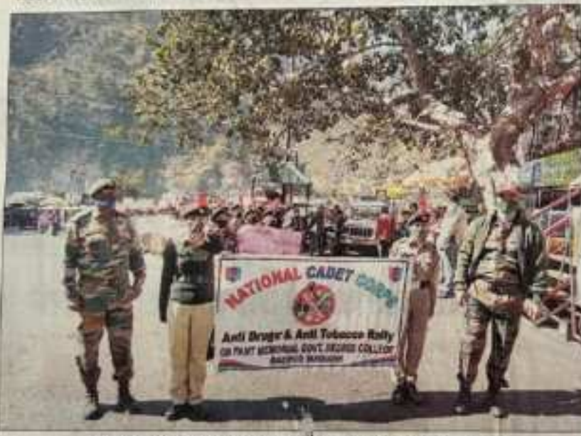
एनसीसी रामपुर कॉलेज के कैडेट्स बाजार में जागरूकता रैली के दौरान। संवाद