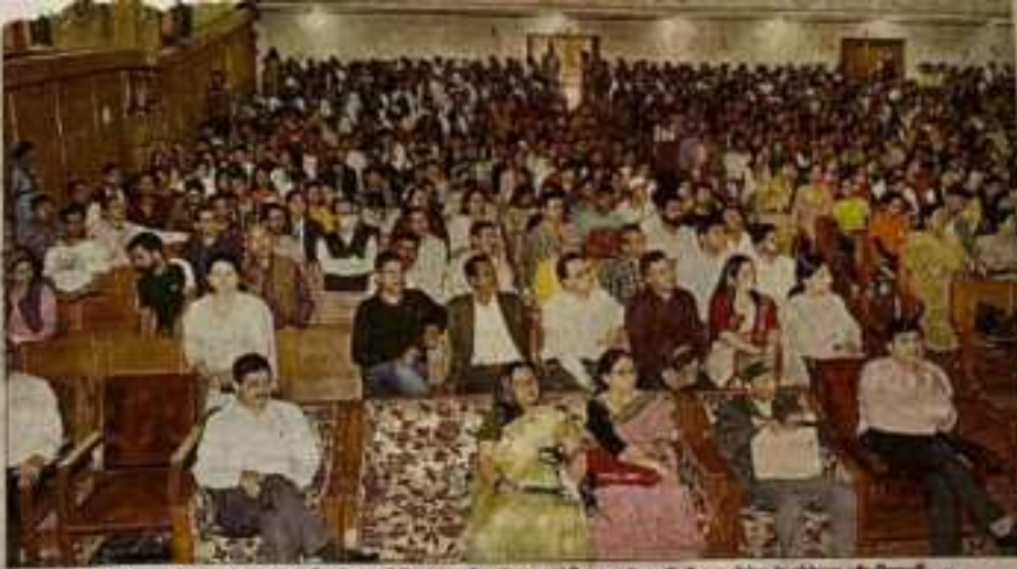
राष्ट्रीय माध्यमिक स्तर के राष्ट्रीय शिक्षा नीति 2020 विषय पर आयोजित कार्यक्रम में मौजूद कार्यक्रम के अध्यक्ष और विशारद।