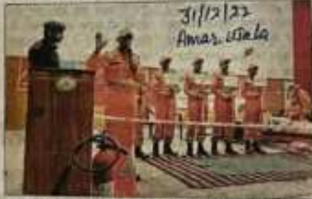
देशी प्रतिरोध रामपुर में आपदा से निपटने के गुरों के प्रशिक्षण।

देशी प्रतिरोध में कुश्वाहा की एनडीआरएफ के आयोजक रामपुर की ओर से रामपुर एवं आसपास के क्षेत्रों में प्रशिक्षण किया गया। कार्यक्रम का शुभारंभ आसपास के सभी एनडीआरएफ सदस्यों और