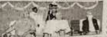
राज्यपाल ने नई शिक्षा नीति के लाभों को बताते हुए कहा कि यह नीति देश के सभी बच्चों के लिए है।