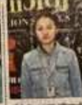
अपराजिता कार्यक्रम में भाग ले रही महिला।