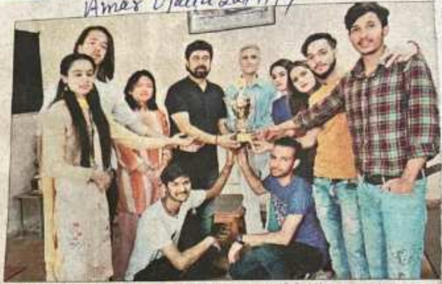
पश्चात्य समूह गान में द्वितीय स्थान पाने के बाद प्राचार्य के साथ पीजी कॉलेज रामपुर के छात्र।

विश्व रामपुर कॉलेज में कार्यक्रम और पंकज ठाकुर