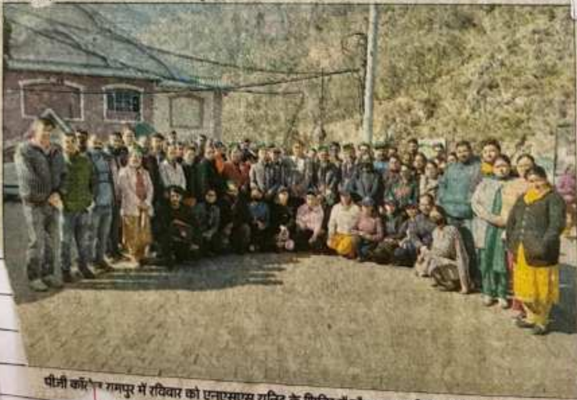
पीजी कॉलेज रामपुर में रविवार को एनएसएस यूनिट के शिविर में मौजूद मुख्यातिथि और अन्य।