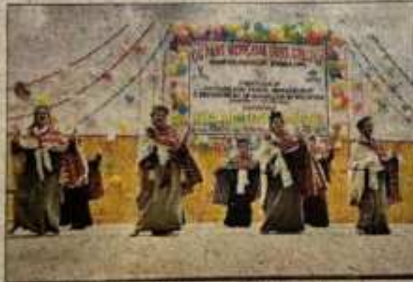
रामपुर कॉलेज में विश्व पर्यटन दिवस पर नाटी पर थिरकती छात्राएं।