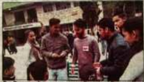
विद्यार्थियों द्वारा शहीद जवानों के पुरस्कार के लिए राशि जुटाई जा रही है।

राज्य शांति एवं व्यवस्था को बनाए रखने के लिए कर्मियों को प्रेरित नहीं किया जा रहा।