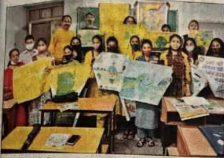
नारा लेखन और चित्रकला प्रतियोगिता के दौरान छात्र और छात्राएं।