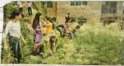
रामपुर कॉलेज में एनएसआर के स्वयंसेवी गार्ड बनते हुए। सदा