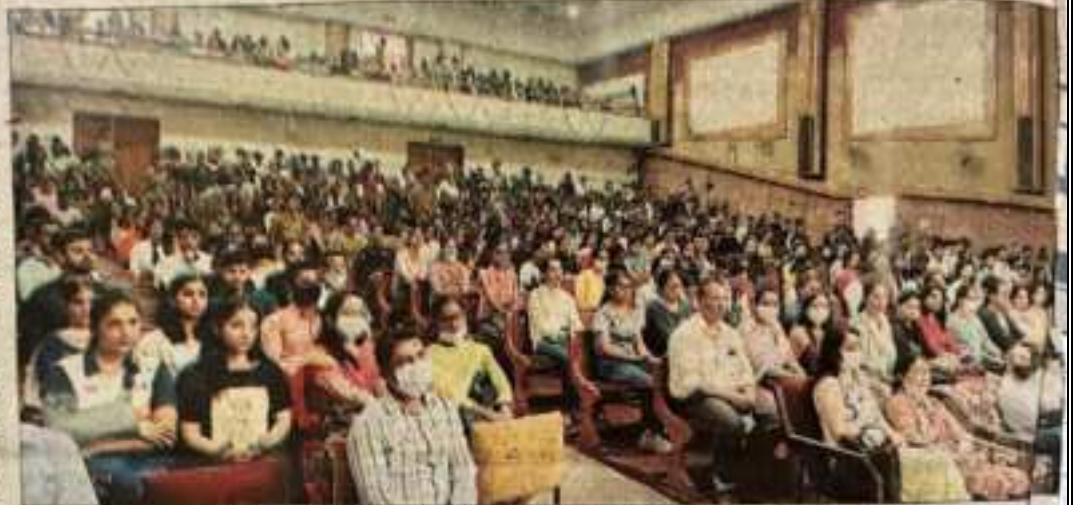
रामपुर कॉलेज में आयोजित सहयोग हमारा संघर्ष कार्यक्रम का कार्यक्रम में मौजूद छात्र-छात्राएं और अन्य।

इससे पहले रामपुर के अधिकतर स्कूलों में भी इस तरह के कार्यक्रम आयोजित किए जा चुके हैं। उन्होंने कहा कि रामपुर साइबेरी भी प्रतिवर्ती परीक्षा के मार्गदर्शन के