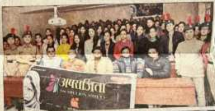
रामपुर पीजी कॉलेज में आयोजित 'अपराजिता' कार्यक्रम में महिलाएं भाग ले रही हैं।

रामपुर, बुधवार। पीजी कॉलेज रामपुर में एम.ए.सी. के अमर उजाला के 'अपराजिता' कार्यक्रम का आयोजन किया गया। कार्यक्रम में महिलाओं को देश सेवा के लिए सेना में भर्ती होकर देश सेवा के लिए कदम बढ़ाएं महिलाएं का संदेश दिया गया। कार्यक्रम में पीजी कॉलेज की छात्राओं को देश सेवा के लिए सेना में भर्ती होकर देश सेवा के लिए कदम बढ़ाएं महिलाएं का संदेश दिया गया।