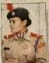
अपराजिता कार्यक्रम में भाग ले रही महिला।

कार्यक्रम में अमर उजाला के अध्यक्षों ने महिलाओं को देश सेवा के लिए सेना में भर्ती होकर देश सेवा के लिए कदम बढ़ाएं महिलाएं का संदेश दिया गया। कार्यक्रम में पीजी कॉलेज की छात्राओं को देश सेवा के लिए सेना में भर्ती होकर देश सेवा के लिए कदम बढ़ाएं महिलाएं का संदेश दिया गया।