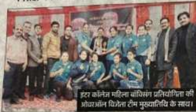
इंटर कॉलेज महिला बॉक्सिंग प्रतियोगिता की ओवरऑल विजेता टीम मुख्यातिथि के साथ।

नगरोटा बगवां में अंतर महाविद्यालय महिला बॉक्सिंग प्रतियोगिता का समापन