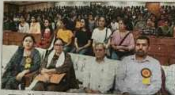
रामपुर कॉलेज में आयोजित कार्यक्रम में मौजूद प्राचार्य और अन्य।