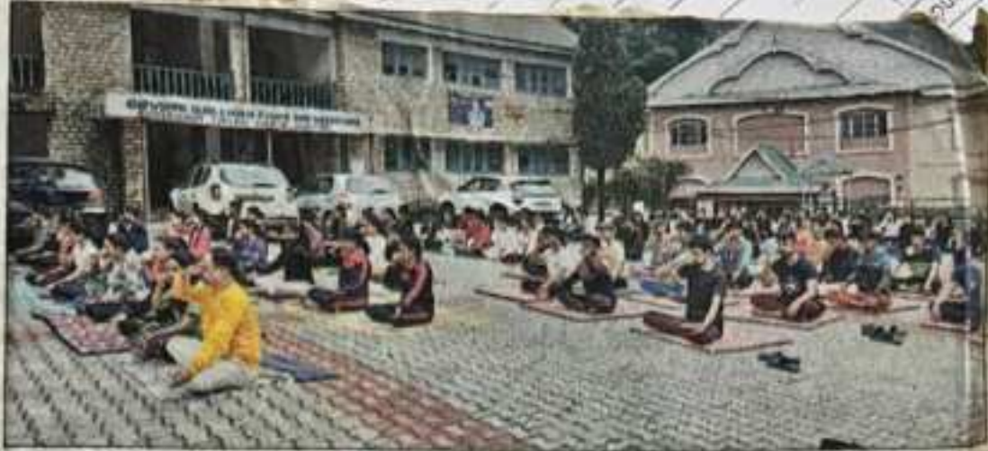
रामपुर कॉलेज में शिक्षकों और विद्यार्थियों को योग के गुर सिखाते हुए।