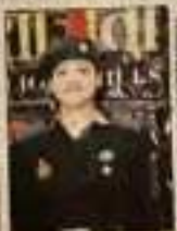
अपराजिता कार्यक्रम में भाग ले रही महिला।