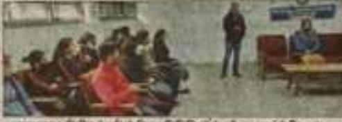
एकसप्ताह शिक्षक के तैयारी दिन-विद्यार्थियों के दौरान स्वयंसेवी। संकाय