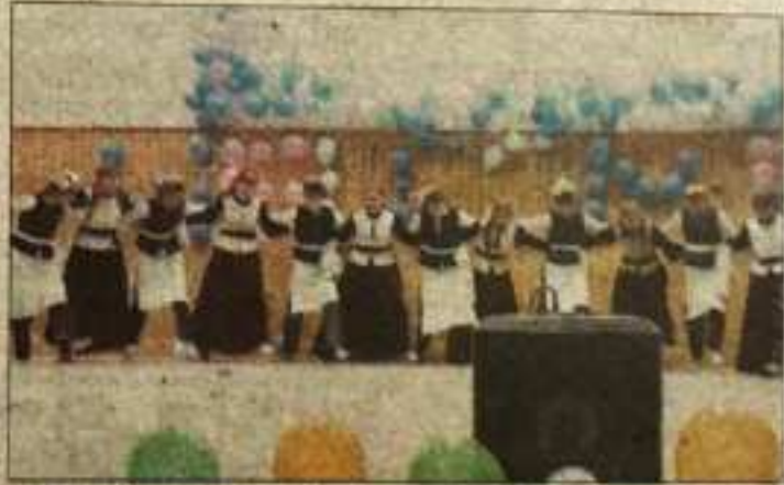
पीजी कॉलेज रामपुर में कार्यक्रम के दौरान प्रस्तुतियां देती छात्राएं।

इसमें जनजातीय छात्र और छात्रावास, ऑर्गेनाइजर, छात्रावास और भद्री छात्रावास के सभी छात्र-छात्राओं ने प्रतियोगिताओं में जोहर दिखाए। इस अवसर पर भाषण प्रतियोगिता, पोस्टर सैकिंग, रंगोली, लेखन, मेहंदी और लोकनृत्य स्पर्धाएं आयोजित की गईं। मुख्यातिथि ने सभी प्रतिभागियों और विद्यार्थियों को प्रतियोगिताओं में भागीदारी